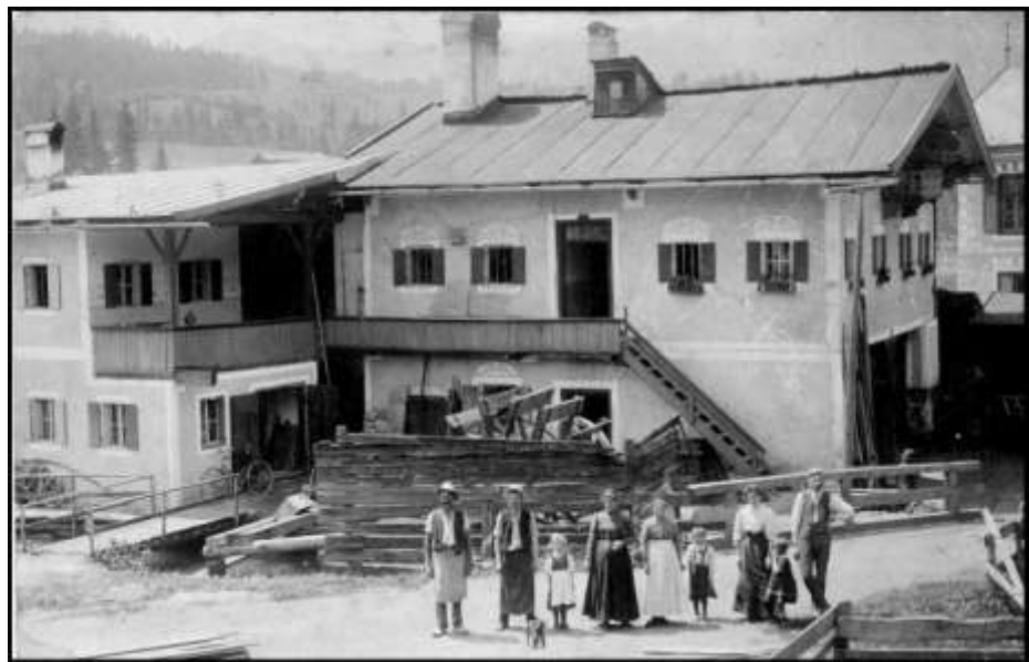
beim Herrenschmied in der Hütte