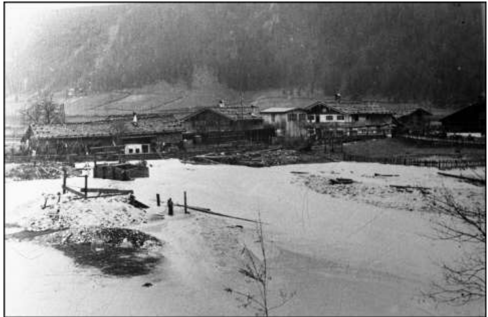
Waidring 1912

Bald trat die Großsache an mehreren Stellen über die Ufer. Praktisch von Jochberg bis Kössen durchbrach sie Dämme, die zum Teil erst im Zuge der Achenregulierung im Bau waren. „Mit großer Anstrengung, die Gefährdung der eigenen Gesundheit mißachtend, setzten sich allenthalben Bürger, Bauern, Arbeiter, teilweise sogar Frauen dem verheerenden Elemente zur Wehr.“