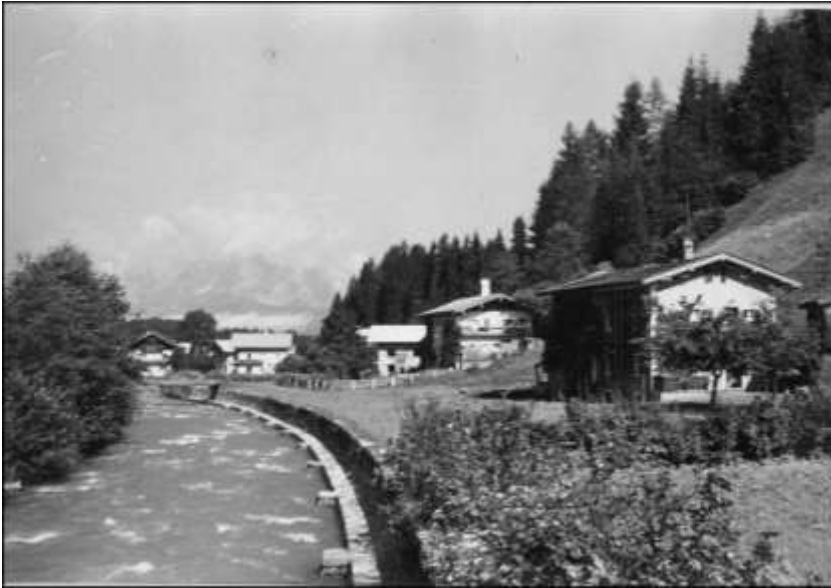
Achenverbauungsmaßnahmen nach dem 1. Weltkrieg

Von der Landesregierung wurde nach der Hochwasserkatastrophe angeregt, eine Wasserbaugenossenschaft zu gründen, der alle betroffenen Fieberbrunner angehören sollten. Ein sogenanntes Konkurrenzkapital wurde festgelegt und sollte durch jährliche Beiträge der Mitglieder gespeist werden. Meist erfolgte eine Projektvorgabe durch die Landesbauleitung, von den anfallenden Kosten hatten die Anrainer 20 Prozent zu tragen. Die Mitglieder waren nach Höhe ihres Haus- und Grundbesitzes und nach Gefahrenklassen eingestuft. Schon über diese Einstufung gab es nie enden wollende Debatten.