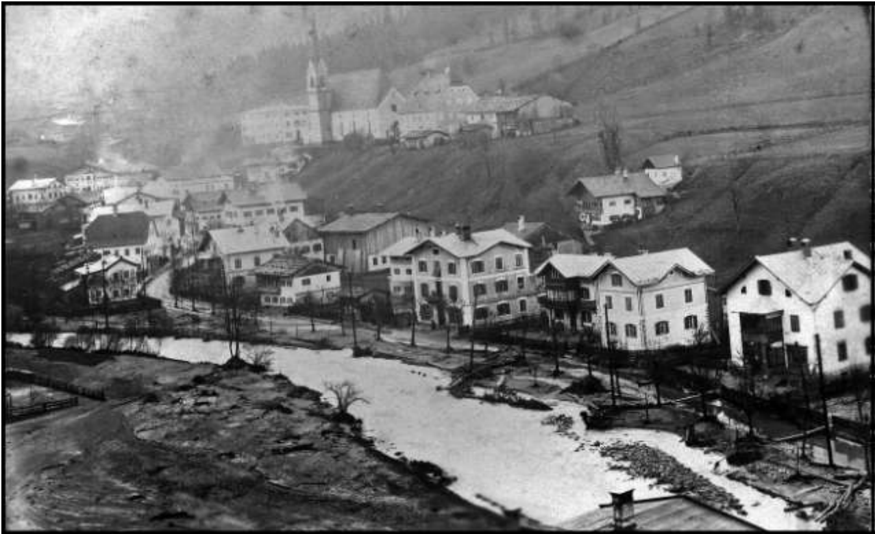
das Dorfzentrum nach dem Hochwasser

„Am 9. Mai um halb 4 Uhr morgens ertönten die Sturmglocken, das Unheil des entfesselten Elements verkündend. Der Weiler Lehmgrube stand in großer Gefahr, ebenso das Auwirthshaus und das Forsthaus, denn die Ache war ausgebrochen und raste direkt auf die beiden Häuser los.“