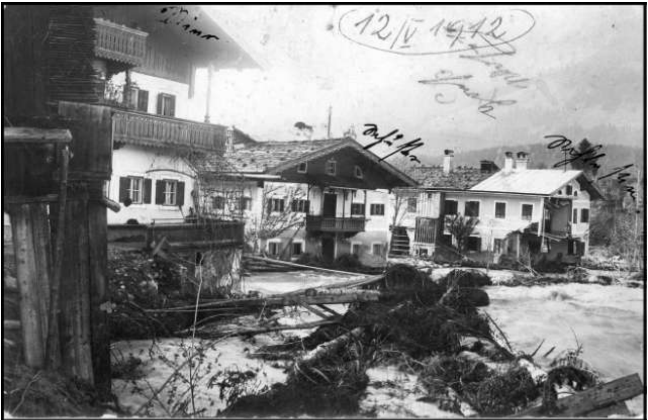
Metzger - Lehmgrubenschuster - Filiale Wenzbauer