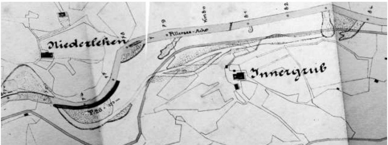
Ausschnitt aus der Karte des Bauamtes (punktiert die verwüsteten Stellen)