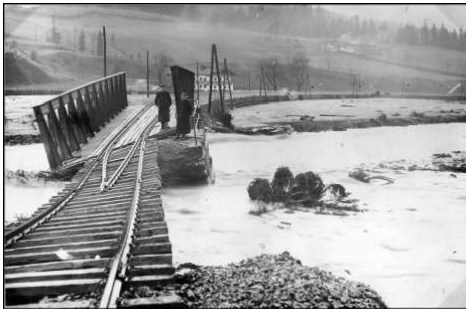
Die unterspülte Eisenbahnbrücke beim Grieswirt

In Waidring durchbrach der Haselbach im Ortsteil Unterwasser den Schutzdamm, das Anwesen „Achner“ des Johann Diechtler wurde unterspült und beinahe zum Einsturz gebracht. Eine Anzahl von Häusern musste sicherheitshalber geräumt werden und das Vieh die Nacht im Freien verbringen.