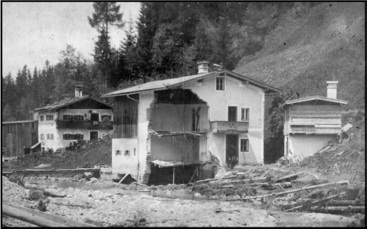
das zerstörte Haus des Gendarmerie-Wachtmeisters Madlener

Auch die Gruberau war vom Hochwasser stark betroffen. Unterhalb des Obermair-Wirtes wurde die Straße auf einer Länge von 200 Metern weggerissen und das oberhalb stehende Wäldchen rutschte gänzlich herunter. Über die Felder des Innergrubbauern floss nun die Ache.