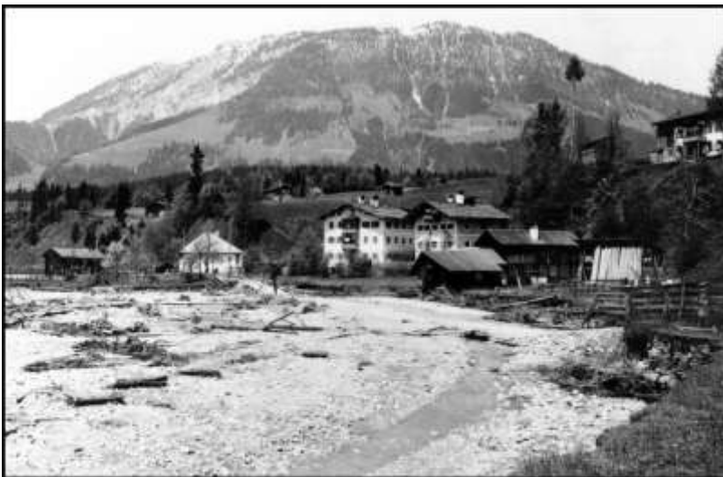
Mitte rechts die Tischlerei Wunsch